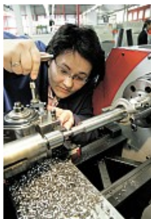
Drehen und fräsen statt Haarschneiden. Ex-Friseurin Holz-

Der Frauentag ist den angehenden Facharbeiterinnen übrigens ziemlich egal. „Frauentag. Gibt’s da Geschenke für uns?“ fragt eine junge Dame am Werkzeugschrank völlig überrascht.